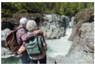
Aufstockung Ihrer Rente

ist unsere Lösung für Ihre Fragestellungen im Alter!