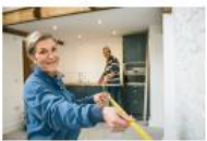
Modernisierung, Renovierung und Sanierung