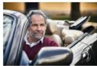
Erfüllung von Ihren Lebensträumen