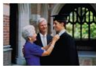
Unterstützung von Kindern und Enkeln

Sie bleiben zu einhundert Prozent Eigentümer/in Ihrer Immobilie